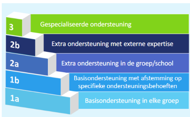
Figuur 1: PO ondersteuningstrap (hoog)begaafde leerlingen. Uit: Routekaart voor ondersteuning van (hoog)begaafde leerlingen in het basisonderwijs.

Om concreter weer te geven welke ondersteuning er nu op de drie lagen wordt geboden, is het wenselijker om de piramide in 5 lagen te verdelen zoals dat door Van Gerven (2015) wordt gedaan. Plein 013 heeft deze piramide vertaald naar de metafoor van de trap (zoals weergegeven in figuur 1) waar de ondersteuningsniveaus (gebaseerd op de ondersteuningsniveaus van het ondersteuningsplan 2022-2025 Plein 013). Binnen Portvolio is dit vertaald naar de ondersteuningsniveaus zoals weergegeven in figuur 2.